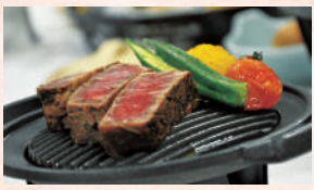
牛ロースの陶板焼き