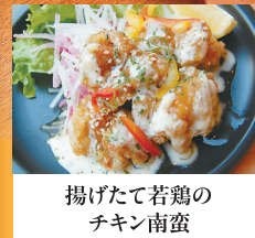
揚げたて若鶏の チキン南蛮