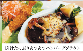
肉汁たっぷりあつあつハンバーググラタン