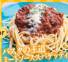
パスタの王道 ミートソーススパゲッティ