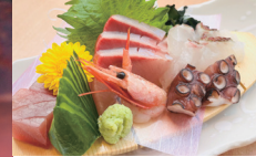
豪華おまかせ お造り盛り合わせ