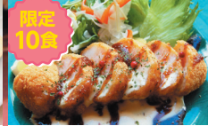
限定 10品 海老100% 海老カツ