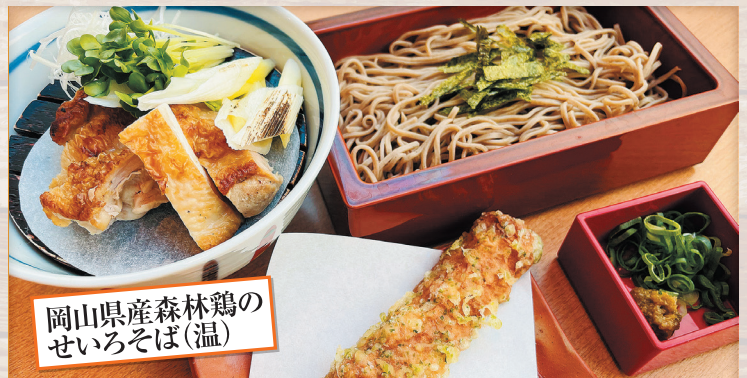
岡山県産森林鶏の せいろそば(温)