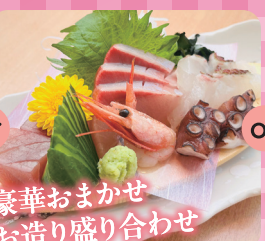
豪華おまかせお造り盛り合わせ