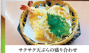
サクサク天ぶらの盛り合わせ