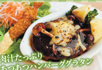
肉汁たっぷり あっあっハンバーググラタン