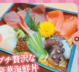
プチ贅沢な豪華海鮮丼