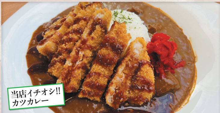
当店イチオシ!! カツカレー