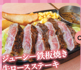
ジューシー鉄板焼き牛ロースステーキ