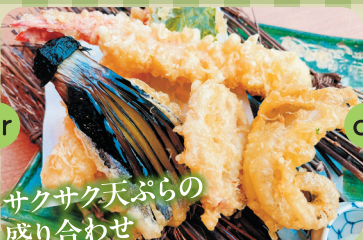
サクサク天ぷらの盛り合わせ