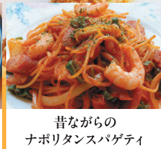
昔ながらの ナポリタンスパゲティ