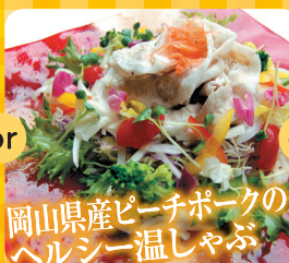
岡山県産ピーチポークのヘルシー温しゃぶ