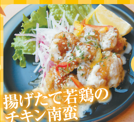
揚げたて若鶏のチキン南蛮