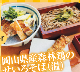
岡山県産森林鶏のせいろそば(温)