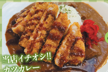
当店イチオシ!! カツカレー