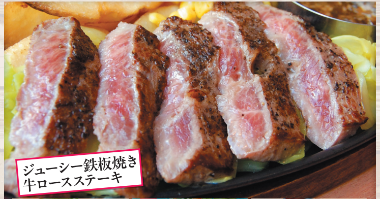
ジューシー鉄板焼き 牛ロースステーキ