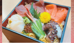
プチ贅沢な 豪華海鮮丼