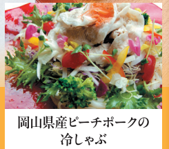
岡山県産ピーチポークの 冷しゃぶ